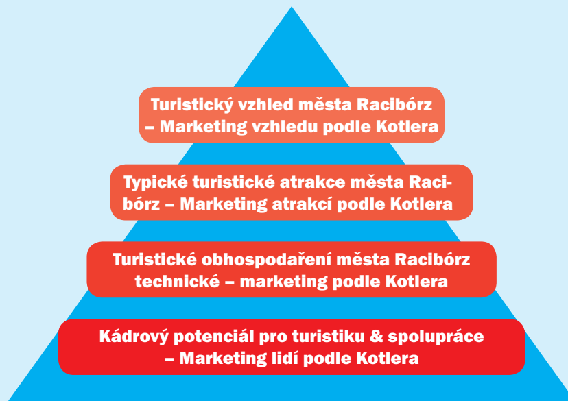
Obr. 2: Turistické obhospodaření města Ratiboř v celkové koncepci marketingu míst