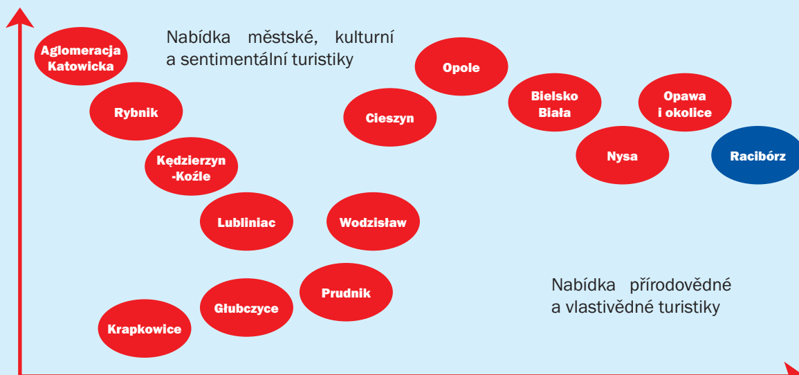
Obr. 1: Cílová pozice turistické nabídky Raciborzi na turistické mapě jižního Polska

Zdroj: Vlastní práce 2ba školení a strategické poradenství