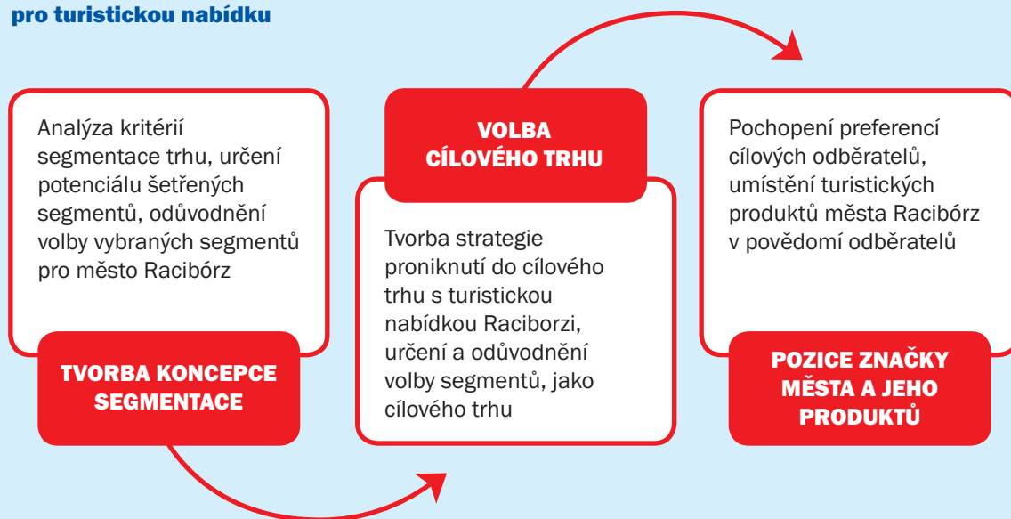
Obr. 1: Schéma procedury segmentace pro turistickou nabídku

Zdroj: Vlastní práce 2ba školení a strategické poradenství